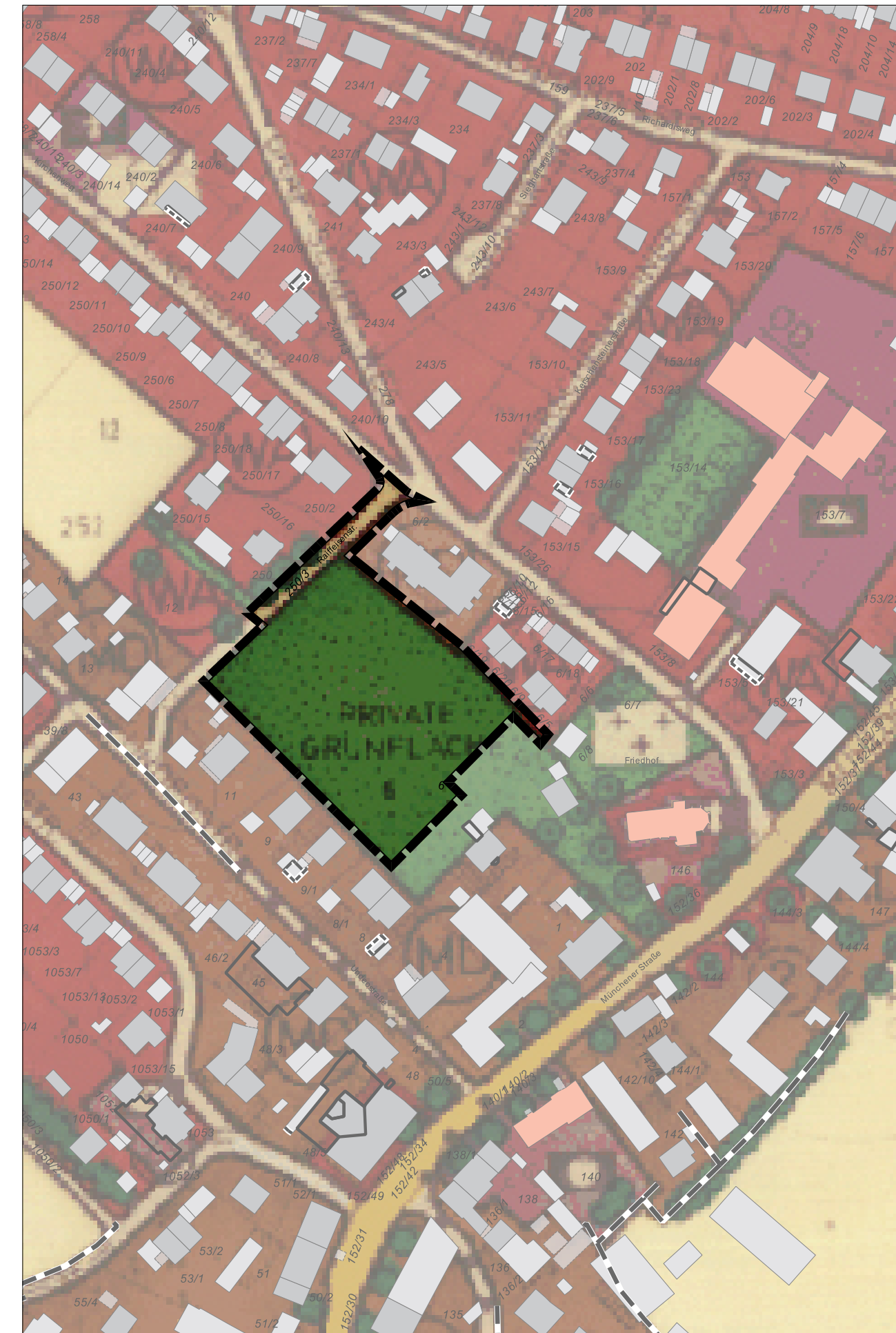
Flächennutzungsplan - bisher gültige Darstellung